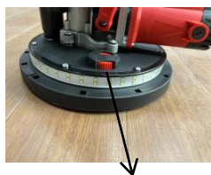
Koło regulujące ssanie

Narożnik po zdjęciu pokrywy krawędzi dysku może sprawić, że płyta z piaskiem zbliży się do ściany.