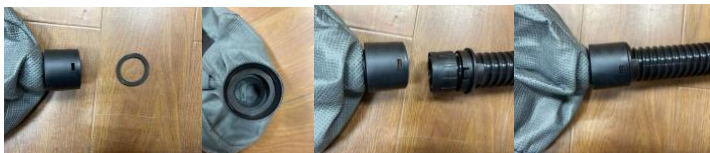
Rozciągnij ogniwo między workiem na kurz a wężem