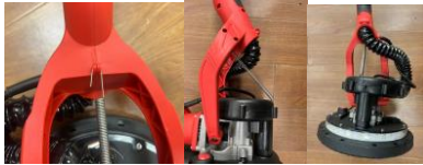
Sprężyna wykorzystująca w wielu toppingach