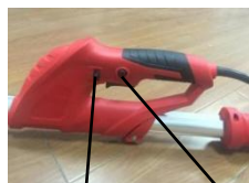
Regulator prędkości Przełącznik