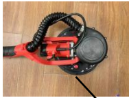
Włącznik światła LED