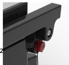
Zwalnianie zawiasu Dźwignia